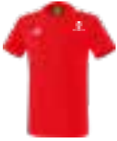
UNISEX ESSENTIAL 5-C T-SHIRT Art. 2081933, Farbe rot