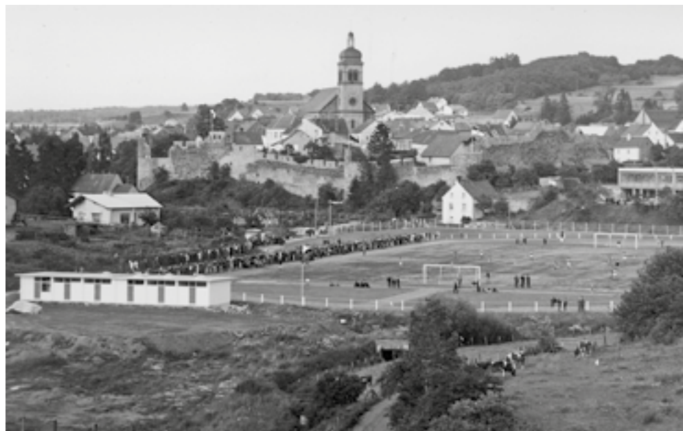
Feierliche Eröffnung der Zentralen Sportanlage im Jahr 1965

Hinzu kam die Eröffnung der neuen Zentralen Sportanlage mit einer 400m-Rundlaufbahn. Bald darauf gelang es auch, eine Leichtathletik-Abteilung aufzubauen, die in den