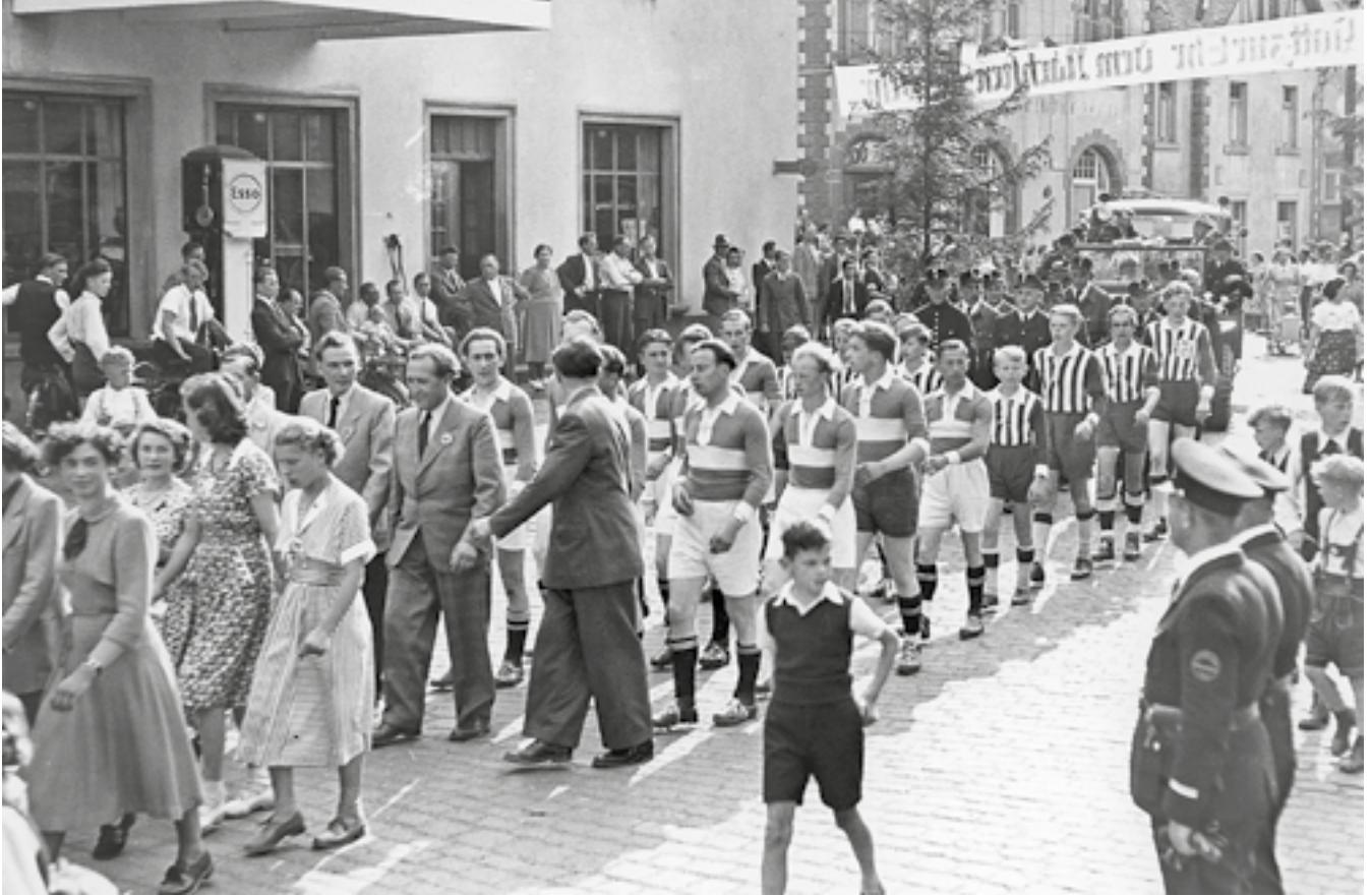
Delegation des VfL Hillesheim beim Kreisfeuerwehrfest 1951.