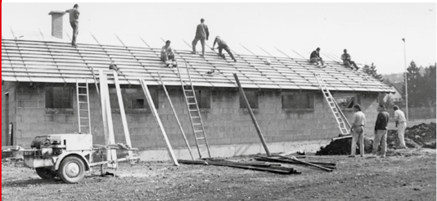
Neubau des Umkleidegebäudes 1992 unter maßgeblicher Eigenbeteiligung der VfL-Mitglieder.

Erstmalig erfolgte dann 1982 eine Komplettsanierung des Aschenplatzes durch die damalige Verbandsgemeinde Hillesheim mit Einbau einer Beregnungsanlage. In Eigenleistung erstellte der VfL zudem eine Flutlichtanlage. Somit