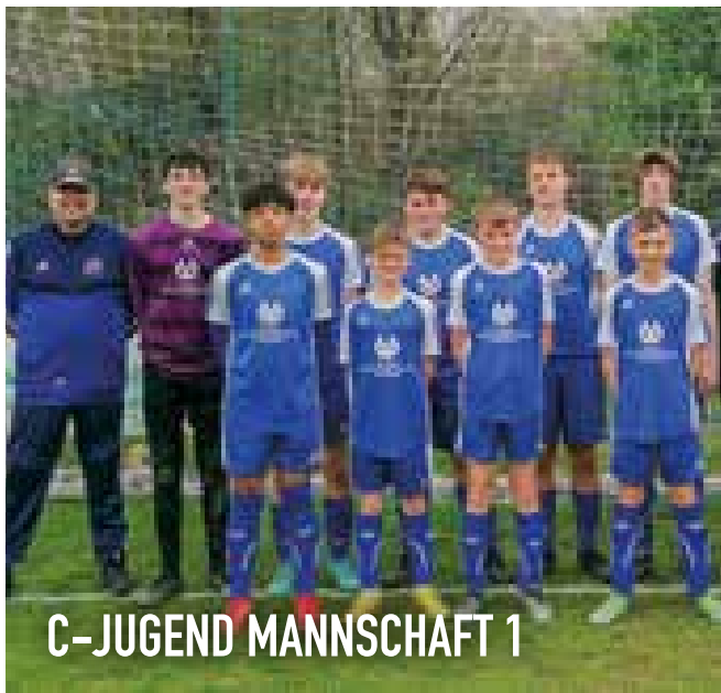
C-JUGEND MANNSCHAFT 1