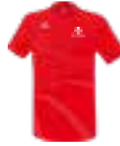
RACING T-SHIRT HERREN Art. 8082301, Farbe rot