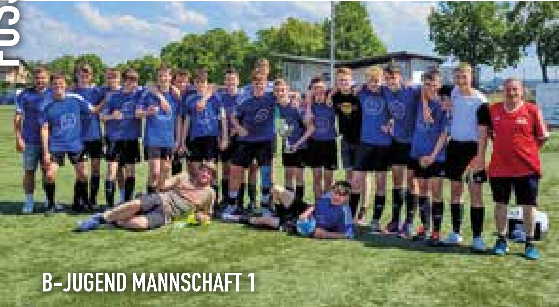
B-JUGEND MANNSCHAFT 1