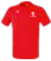
HERREN FUNKTIONS TEAMSPORT T-SHIRT Art. 208652, Farbe rot