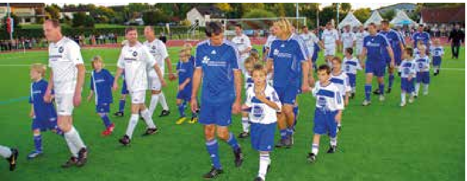
Die Hillesheimer „Alten Herren“ (in weiß) beim Benefizspiel der Lotto-Elf anlässlich der Einweihung des Kunstrasenplatzes im Jahr 2010.

Kontakt: Guido Kloep E-Mail: guidokloep@gmx.de Telefon: 0177 6843207