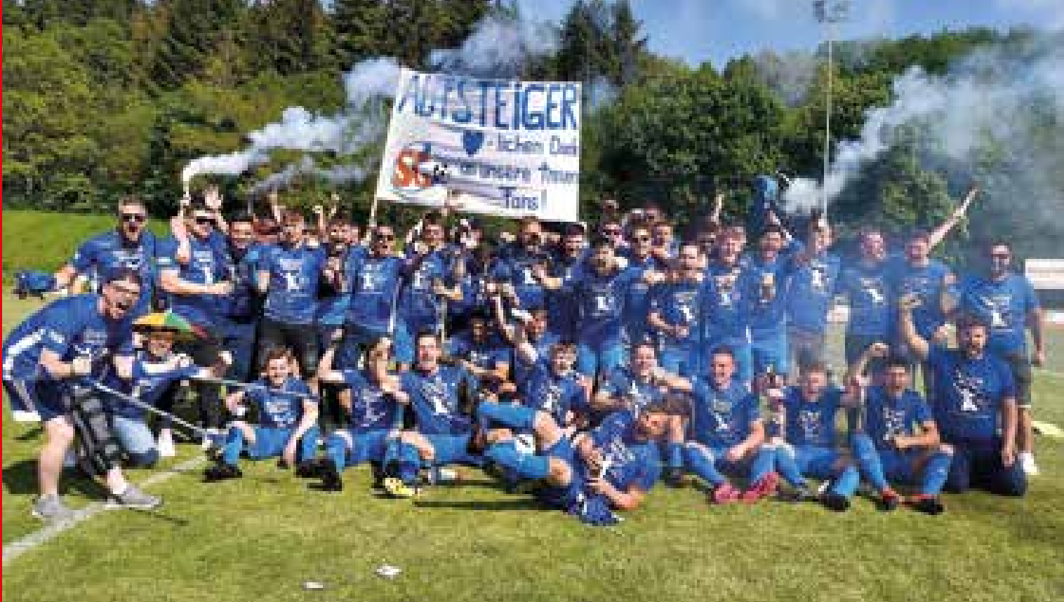
Glückliche Gesichter nach dem Staffelsieg der Kreisliga B-1 in Dreis-Brück.