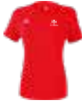
DAMEN FUNKTIONS TEAMSPORT T-SHIRT Art. 208614, Farbe rot