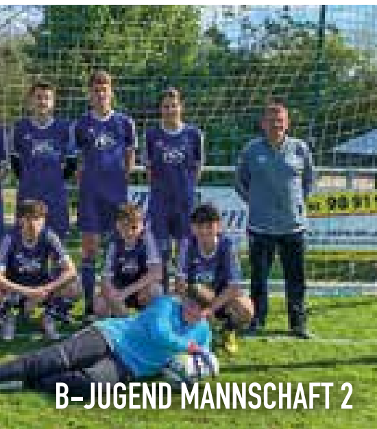
B-JUGEND MANNSCHAFT 2