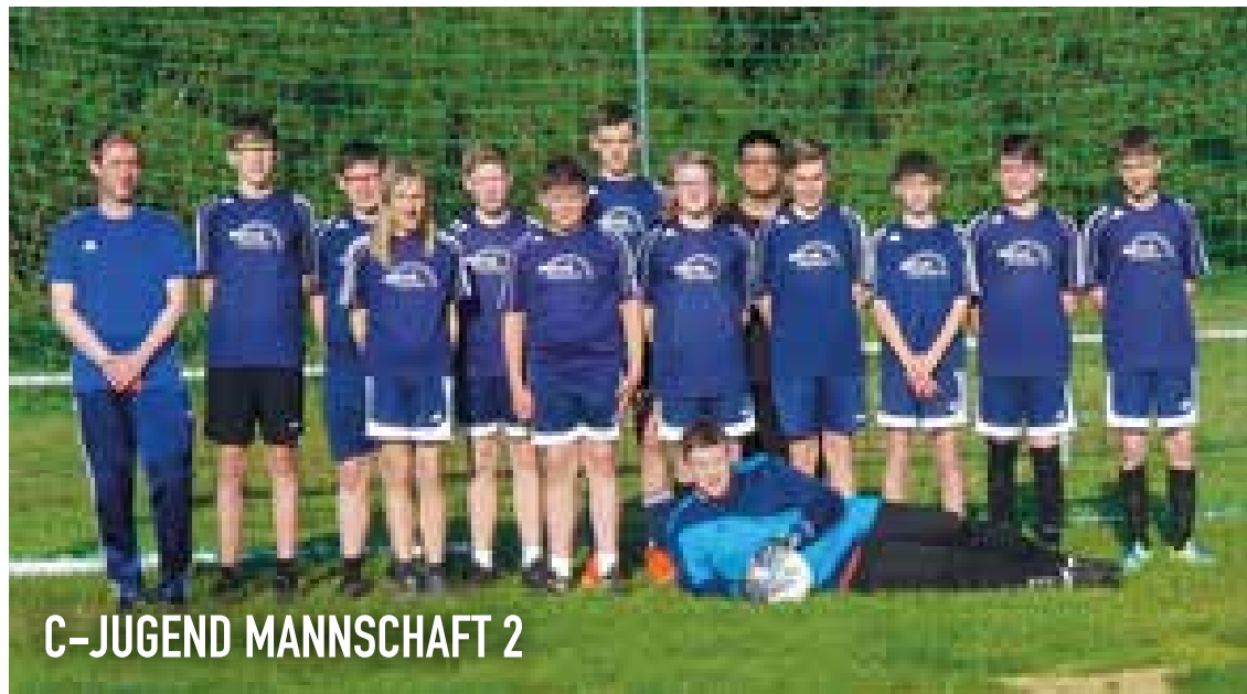
C-JUGEND MANNSCHAFT 2