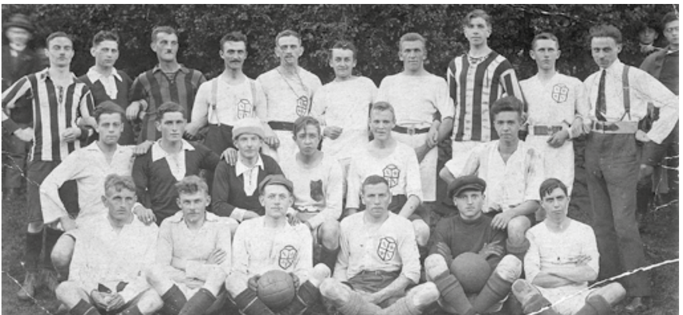
Mannschaftsfoto aus den ersten Jahren.