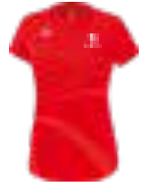
RACING T-SHIRT DAMEN Art. 8082307, Farbe rot