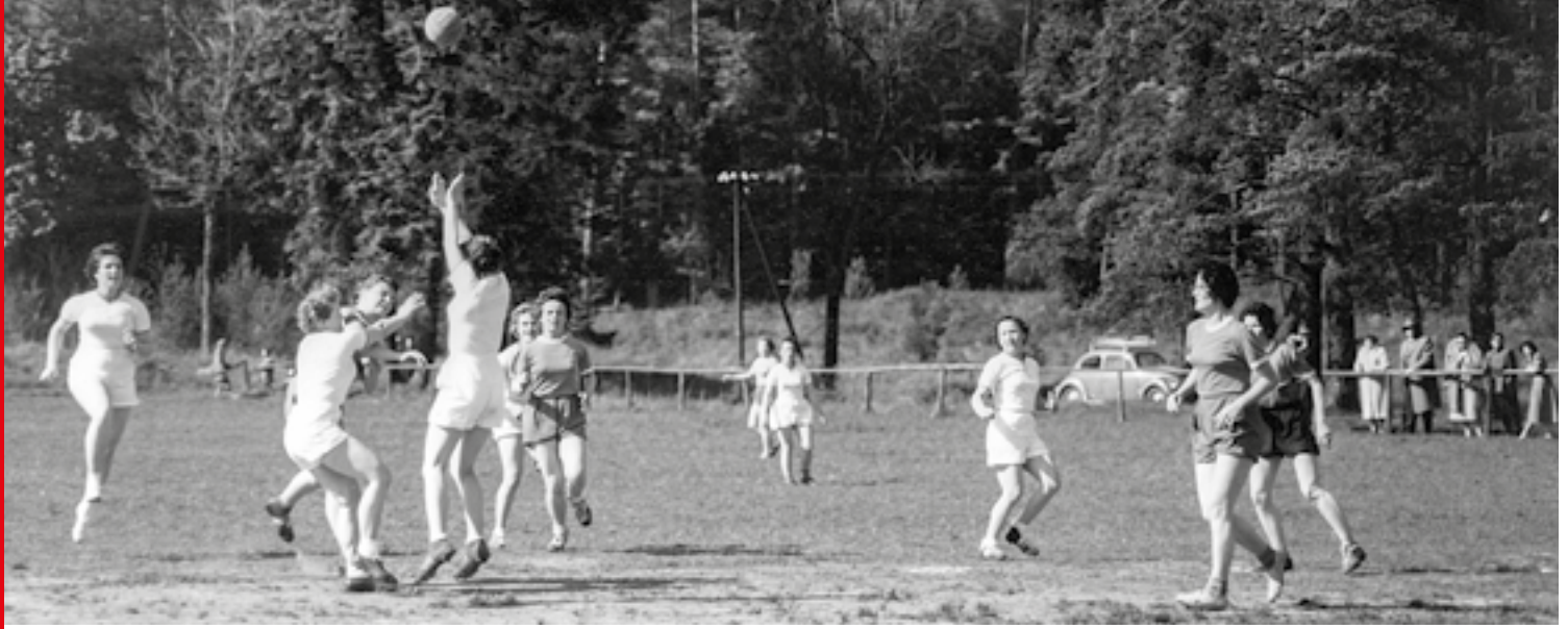
Oben und unten: In den 1950er und 60er Jahren kamen die Sportarten Feldhandball, Leichtathletik und Boxen zum VfL-Angebot hinzu.

Ein erstes Kräftenessen mit dem SV Gerolstein konnte mit einem deutlichen Sieg der Hillesheimer Mannschaft erfolgreich beendet werden. Man muss die Begeisterung der Spieler bewundern, denn es ist zu bedenken, dass sie gerne weite Wege bei den damals herrschenden Verkehrswidrigkeiten auf sich nahmen, nur um ihrem geliebten Fußballsport nachgehen zu können. Die Bindungen der Hillesheimer Fußballer reichten damals sogar bis nach Köln: Die Mannschaft aus Köln-Weidenpesch war hier zu Gast und empfing die Hillesheimer zum Rückspiel, das allerdings mit einem klaren Sieg für die überlegenen Gastgeber endete.