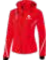
DAMEN SOFTSHELLJACKE FUNCTION Art. 9060711, Farbe rot/weiß