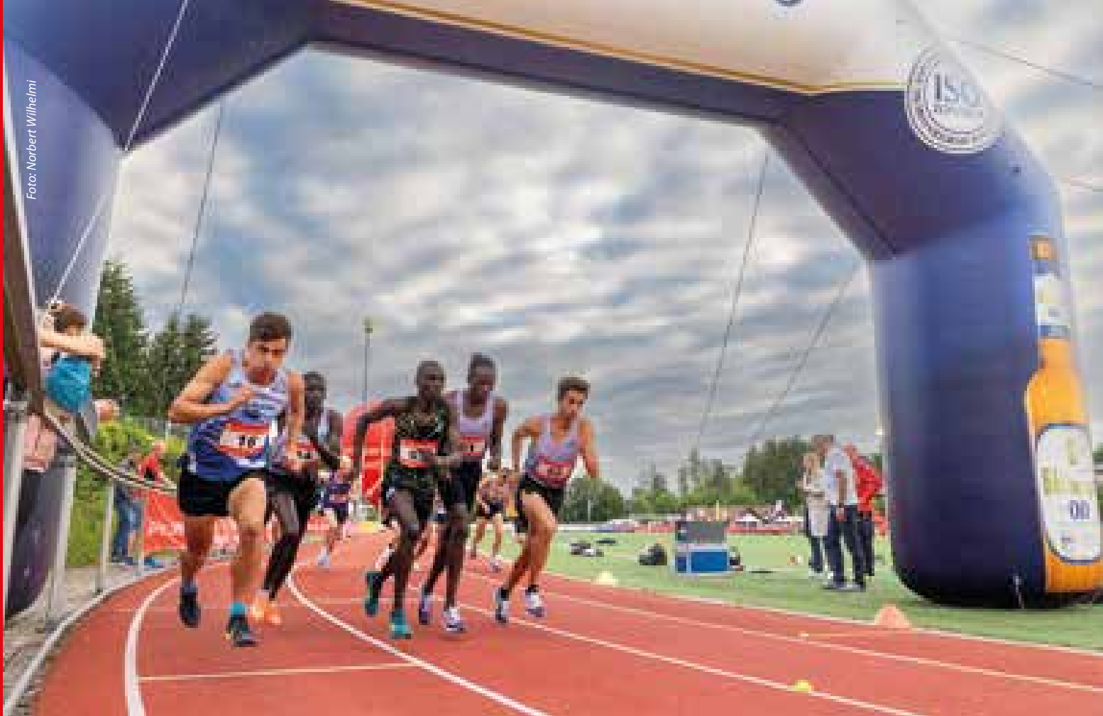
Startszene beim Sparkassen-Invitational 2022 mit dem späteren Sieger Isaac Kimeli (Startnummer 01), der die 5000 m-Distanz mit einer Weltklasse-Zeit von 13:16,99 Minuten für sich entschied.

den vergangenen Jahren mit einigen Preisen des Landesportbundes und der Sparkassen ausgezeichnet. Um die 50 Teilnehmer legen regelmäßig ihr Sportabzeichen ab.