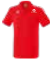
UNISEX ESSENTIAL 5-C POLOSHIRT Art. 2111902, Farbe rot/weiß