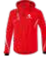
HERREN SOFTSHELLJACKE FUNCTION Art. 9060709, Farbe rot/weiß